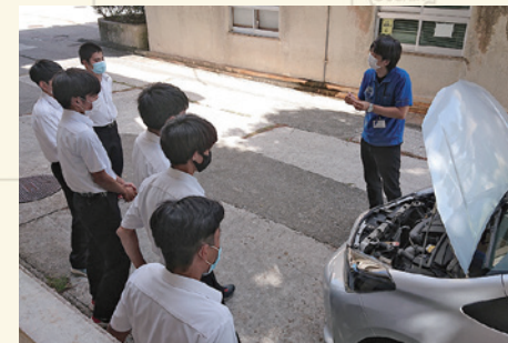
体験型職業ガイダンス