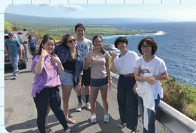
ハワイ短期留学(R1年度)