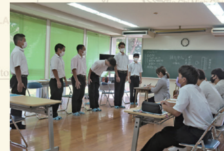
ハローワーク就職マナー講座