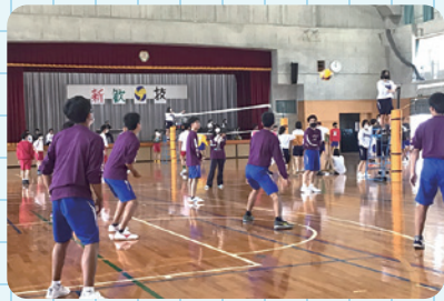
新入生歓迎球技大会