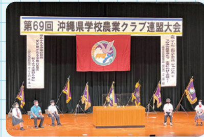
県農業クラブ連盟大会