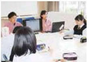
進路別ガイダンス