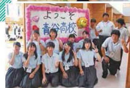
中学生一日体験入学(オープンキャンパス)