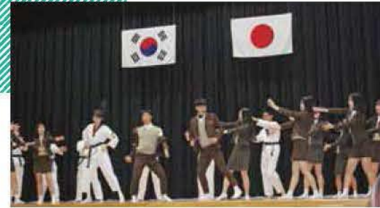
韓国居昌中央高校