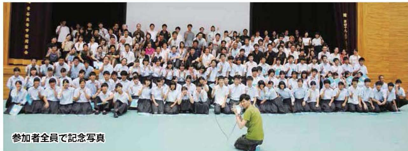
参加者全員で記念写真