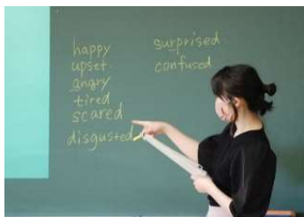
日本および世界の言語・文化・歴史などについて学びます。

日本、世界の言語・文化・歴史を学ぶ科目群です。大学進学希望者はもちろん、興味があって教養を高めたい人にもオススメ。地域の歴史や文化も学びます。