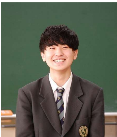
2023年3月卒業（網走市立第一中学校出身）

私は進学する予定だったので「理数数学」や「コミュニケーション英語Ⅲ」など、大学でも必要な授業を選択しましたが、斜里高校は進路に合わせて「情報処理」や「簿記」なども選ぶことができます。総合学科だからこそ自分に合った科目を選択でき、自分の進路と真剣に向き合うことができたので、斜里高校に入って良かったと思います。これからは斜里高校で学んだことを活かして、先生になるために頑張っていこうと思います。