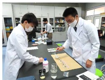
数の概念や原理・法則、自然現象や自然環境について学びます。写真は理科の授業の様子

理工系の大学や医療・看護系進学に対応する科目群です。基礎から発展まで学べる内容になっています。また、地域の自然や環境についても学びます。