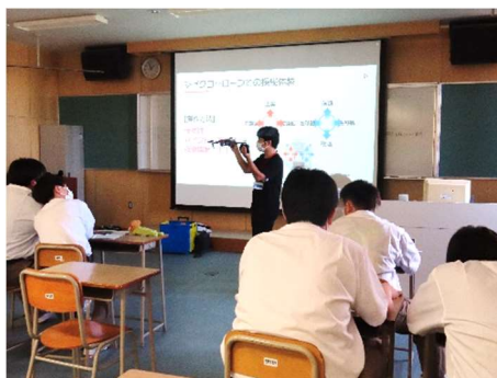
ドローンの操作方法を勉強中。