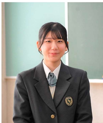
2023年3月卒業（斜里中学校出身）