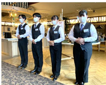
2年次には3日間のインターンシップを行い、自分の適性や働く意義について考えます。

科目選択の鍵となるのが、「産業社会と人間」の授業（週2時間）。総合学科は目指す進路や興味・関心によって科目を選べる学科です。そのため、自分を深く理解すること、様々な仕事や上級学校について知ることを重視します。そして、進路目標を定め、高校3年間で自分がどのように成長したいかをイメージしていきます（My School Life Planの作成）。また、自分の考えをまとめたり、伝えたりするプログラムを通してコミュニケーション力を高めます。