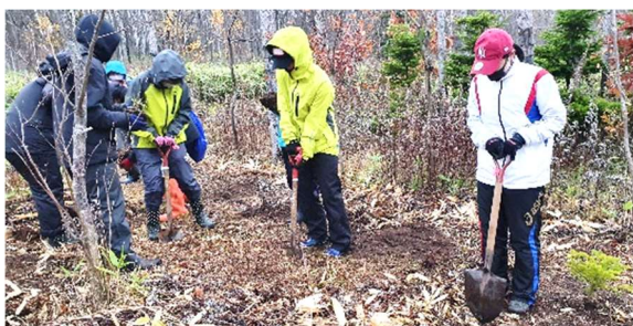
専門家をガイドに招いて世界遺産知床を実際に体験し、地域の魅力や課題を再認識します。