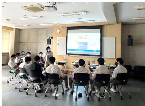
地域映画の予告編を制作しました。

1～3年次生混合で行うゼミナール活動。外部講師をお招きし、様々なテーマで探究活動を行い、成果を発表します。