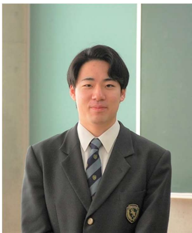
2023年3月卒業（斜里中学校出身）

勉強はあまり得意な方ではありませんが、進学後は自分の将来の夢のためにも熱心に取り組んでいこうと思っています。斜里高校で身につけたことを活かし、周囲の人たちや家族への感謝の気持ちを忘れずに、これからの専門学校生活を過ごしていきます。