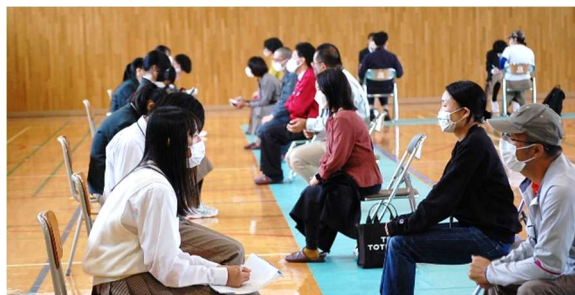
地域の様々な職業に従事している大人と対話をするトークフォークダンス。対話を通してコミュニケーション力を養うだけでなく、視野をひろげていくプログラムです。