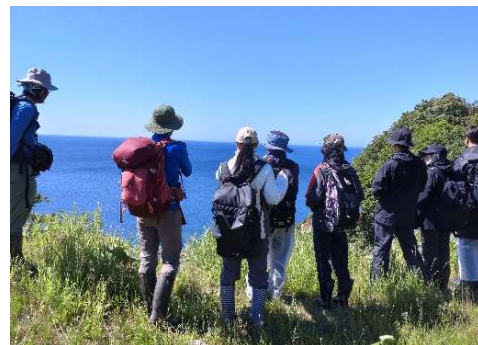
普段は触れられない知床を体験します。