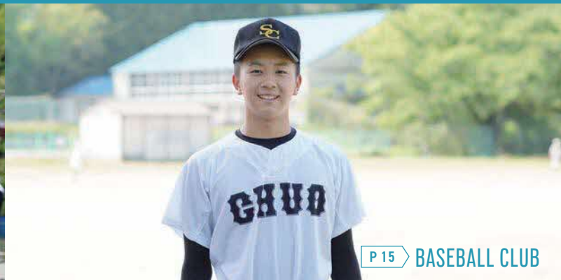
P 15 BASEBALL CLUB