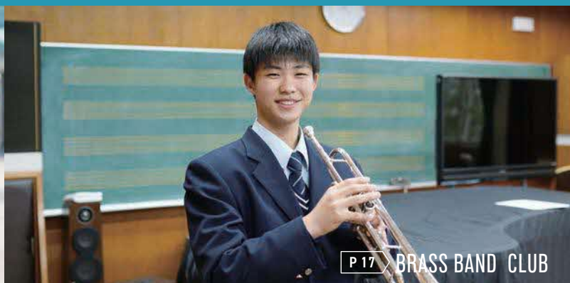
P17 BRASS BAND CLUB