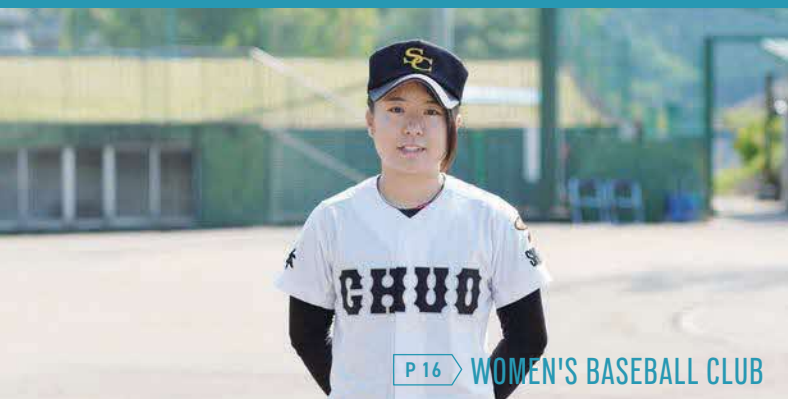
P16 WOMEN'S BASEBALL CLUB