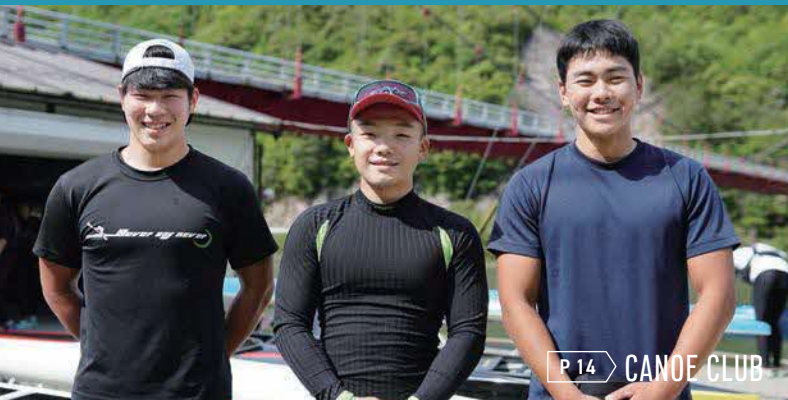
P 14 CANOE CLUB