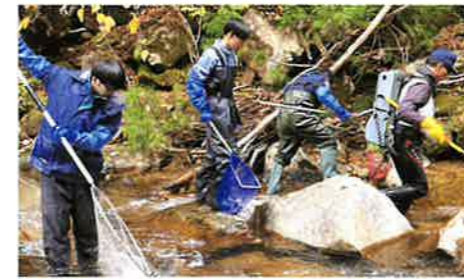
ブラウントラウトボランティア

智頭農林高校では地域で学ぶ専門高校として、智頭町全体をフィールドにたくさんの活動を行ってきました。今もその取り組みが脈々と受け継がれています。町全体の93%が森林である大自然とそこに暮らす人々のあたたかさに触れて、“のりん生”は成長していきます。