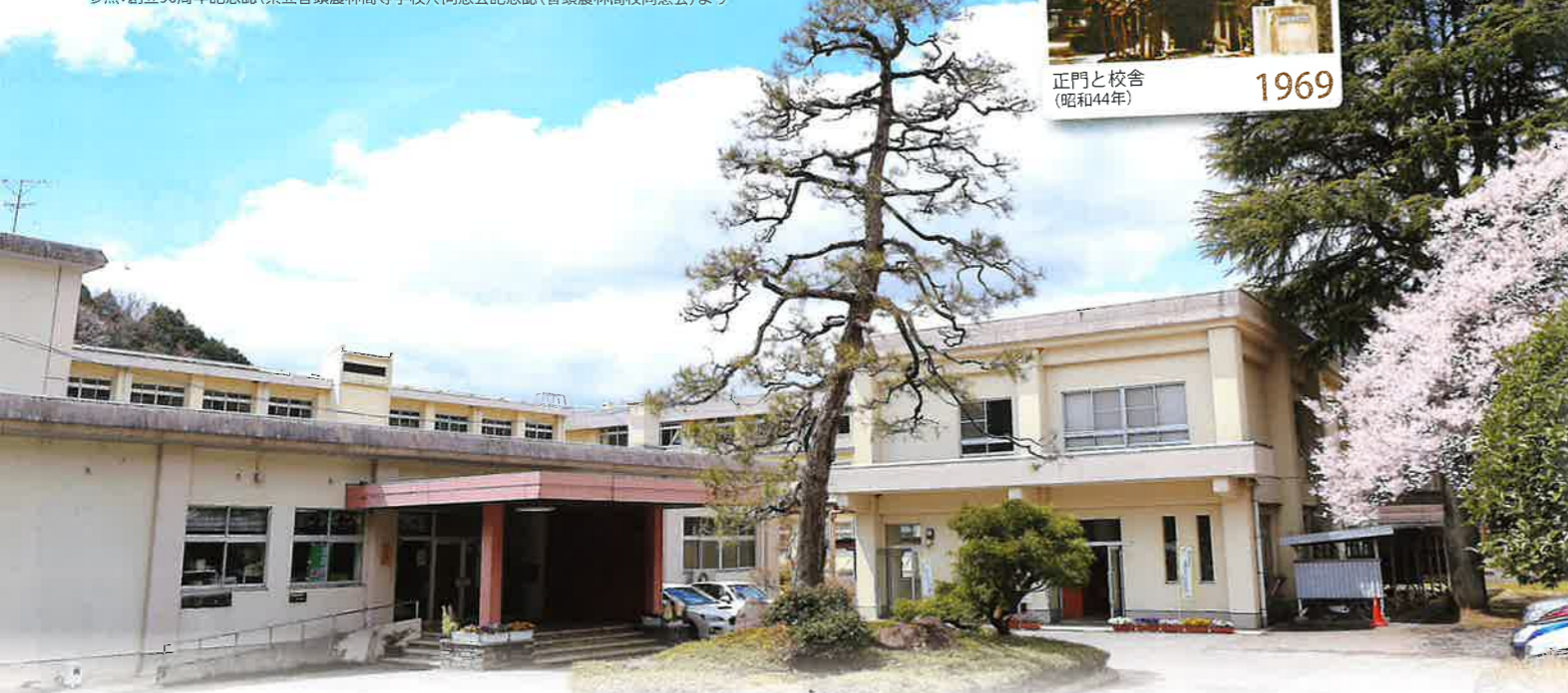
(案)令和6年度入学者教育課程表展開図