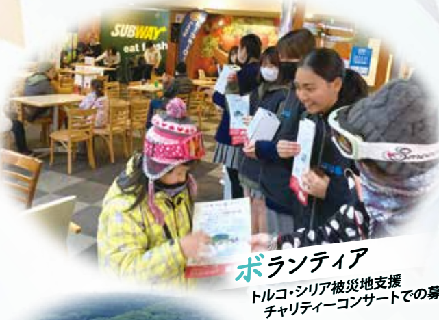
ボランティア トルコ・シリア被災地支援 チャリティーコンサートでの募金活動