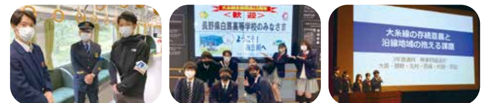
| JR西日本の方へインタビュー | 歓迎していただきました | 白馬フォーラムで発表

白馬村・小谷村を結ぶJR大系線は廃線の危機に直面しています。フィールドワークを行い、その結果を踏まえ、高校生の視点から大系線の利活用促進案を考えました。