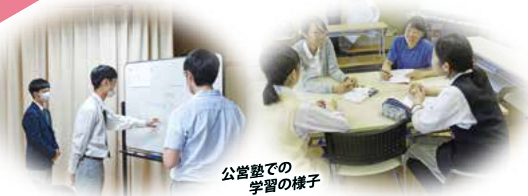
公営塾での 学習の様子