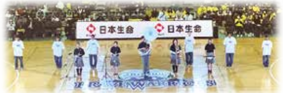
吹奏楽部:信州プレイブウォリアーズのホーム戦でオープニングアクト