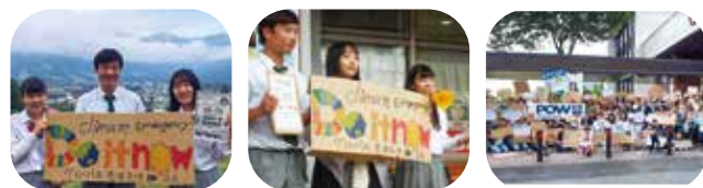
| 仕掛け人の3人 | マーチ開始前 | 村役場前で集合

気候変動に危機感を覚えた生徒たちの課題意識が地域を巻き込んだ運動に発展し、県内自治体では初となる、白馬村の気候非常事態宣言発出につながりました。