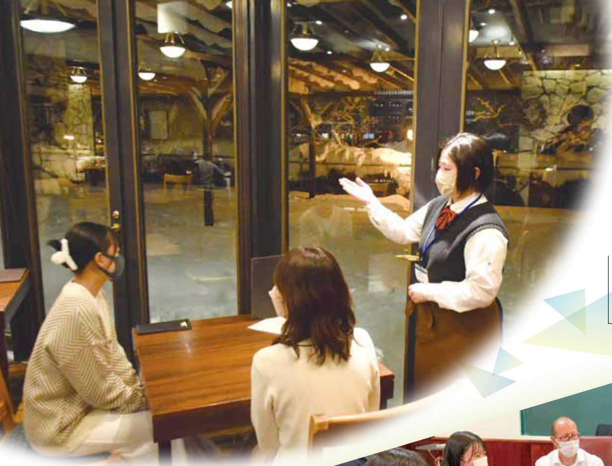
高校生ホテル実習