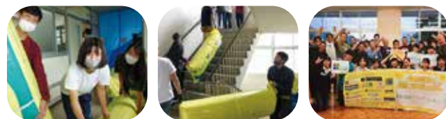
| プロジェクトを主催した3人 | 資材の運び込み | 作業したみんなで記念撮影

「環境に配慮した学習空間づくり」として白馬SDGsラボ、大学教授、地域、多くの方々が生徒が協力して、教室の断熱改修を行いました。