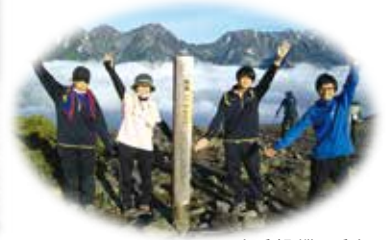
山岳部:蝶ヶ岳山頂