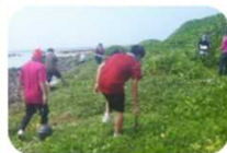
島内清掃 ボランティア