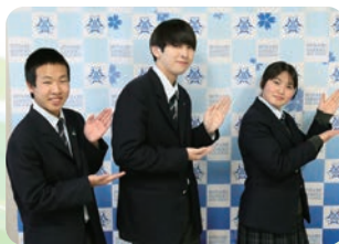
生徒会長・ 副会長挨拶

皆さん、こんにちは。本校は、令和5年度より宮城県の公立高校で初となる全国募集「南三陸 kizuna 留学」を行い、校名を南三陸町と同じく「南三陸高校」に改めました。創立以来、「地域・社会に貢献できる人財の育成」を目指して教育活動を行い、12,700名余りの卒業生を輩出し、現在に至っています。まもなく、創立100周年を迎える歴史と伝統を有する学校です。また、本校は県内高校初のコミュニティスクールとして次の100年へ向けて新たな一歩を踏み出そうとしています。本校で共に学び、南三陸町を盛り上げていきましょう。